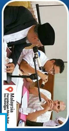
Malaysia Prestium Melayu Baitul